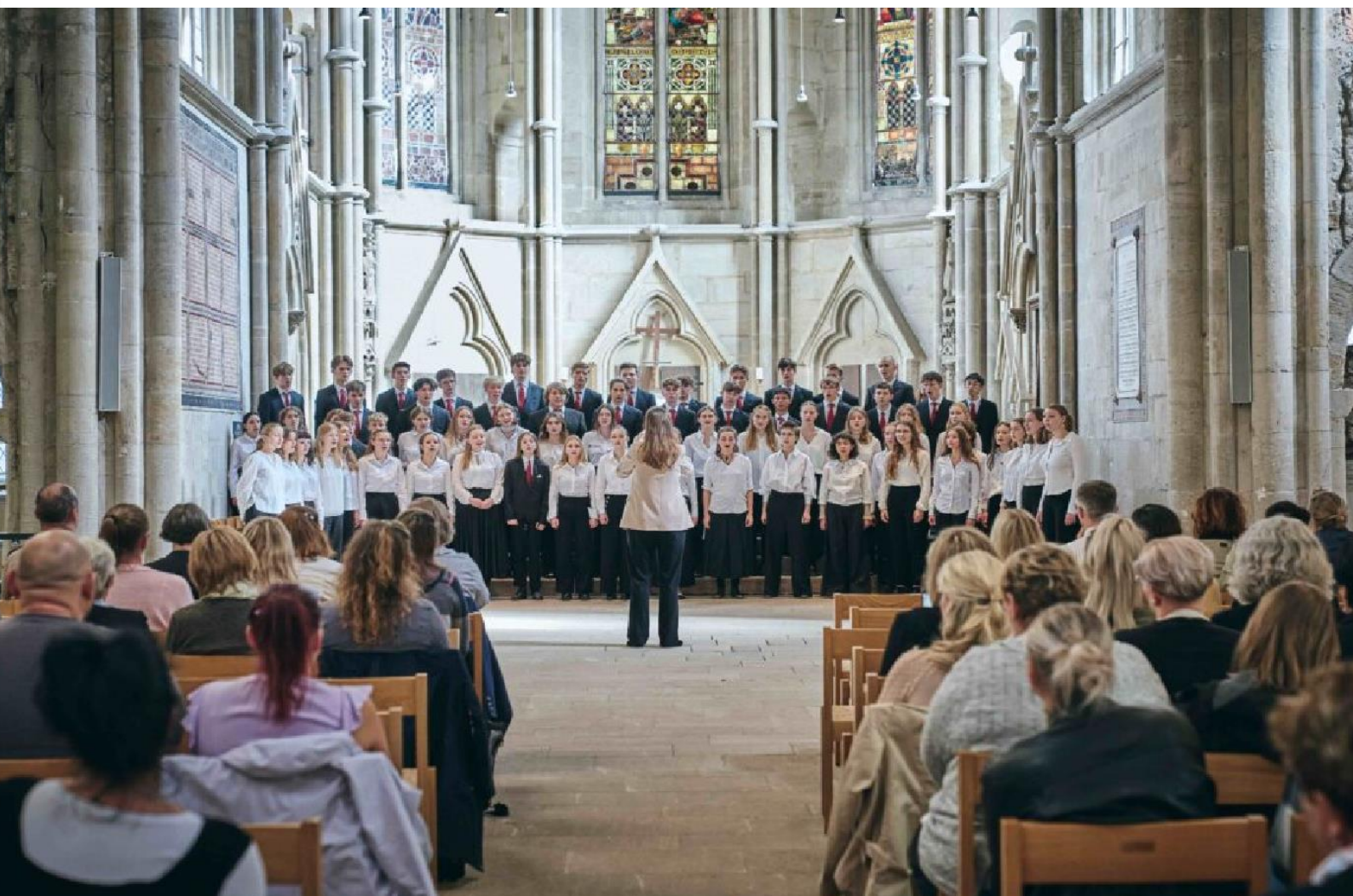
Gemischter Chor der Landesschule Pforta sowie Mitarbeitende der Diakonie Naumburg-Zeitz, Foto: Lichtkegel-Fotografie

Jahreslosung 2025: „Prüft alles und behaltet das Gute.“